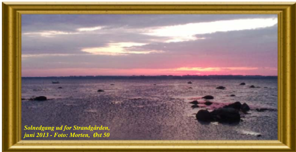
Solnedgang ud for Strandgården, juni 2013

GF's mail adresse: gf@strandgaarden-tusenaes.dk GF's hjemmeside: www.strandgaarden-tusenaes.dk