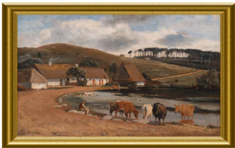
Johan Thomas Lundbye - Køer vandes ved et Gadekær – 1844