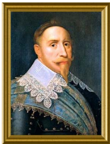
Gustav 2. Adolf af Sverige

Efter mange hel- og halvhjertede forhandlinger – med til- og fraspring – og ikke mindst for at holde Sverige væk fra Nordtyskland, gik Christian 4. i 1625 ind i den store krig. Ikke som konge af Danmark-Norge, men i sin egenskab af hertug af Holsten. Det danske rigsråd ville ikke være med, for de anså ikke krigen som en religionskrig, men som Christians private krig for at sikre sig områder – og indtægter – i Nordtyskland, bl.a. til nogle af sine små sønners underhold. Det gik ikke helt efter planen – men mere om denne (frygtelige) historie i næste nummer.