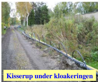
Kisserup under kloakeringen

Endnu en udfordring bliver jo nok udstykningens kloakering, som vi godt nok ikke bør forvente gennemført i 2014, men som bestyrelsen til gengæld skal være meget opmærksom på, og i konstruktiv dialog med Holbæk Forsyning om, for så forhåbentlig at blive hørt, når arbejdet skal sættes i gang, muligvis i 2015.