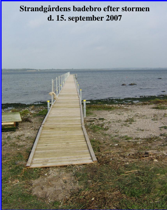
Strandgårdens badebro efter stormen d. 15. september 2007

Lørdag d. 15. september vågnede alle i Strandgården til lyden af et bragende stormvejr. Himmel og hav stod i ét og vejrudsigten fra DMI lød på en vindstyrke på over 22 m/s.