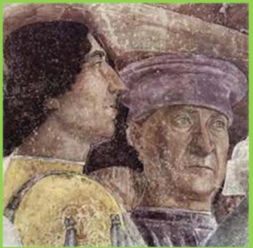
Mantegna: Kejser Frederik 3.og (tv.) Christian I. i Paladset i Mantova.

Der havde været rigeligt at se til for dem, der skulle stå for forplejningen og det andet praktiske på en sådan tur. Hvor meget kongens selskab medbragte vides ikke. Ud over kongen deltog marsken, en rigsråd, kongens skriftefader og andre gejstlige, samt en velvoksen, bevæbnet eskorte. Det var ingen helt ufarlig tur. Der var mange grænser, der skulle passeres og flere steder kræves formentlig et lejdebrev, der gav selskabet ret til at drage gennem grevskabet, hertugdømmet eller hvad det nu gjaldt. Skønt det primært drejede sig om kejserligt territorium, var der ofte interne stridigheder mellem de lokale borgherrer og mistænksomheden var stor. Kejserens autoritet var på ingen måde afskrækkende. Men han var ikke uden betydning, og det vidste kongen udmærket. Han var sædvanligvis velunderrettet om forholdene mellem Eideren og Alperne.