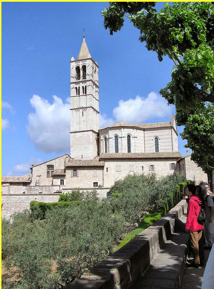
Basilica di Santa Chiara (Clara) i Assisi. Påbegyndt 1257 og indviet 1260, da Claras jordiske rester blev begravet foran højalteret. Mere om hende inde i bladet.

Bankkonto: Danske Bank Reg.nr. 9570 – Konto nr. 0012629303