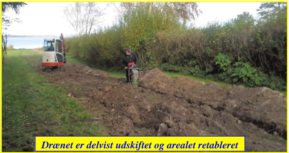
Drænet er delvist udskiftet og arealet retableret

Udskiftning af dræn: Det har været nødvendigt at udskifte 90 mm drænrør til et fast 160 mm pvc rør fra den nordligste brønd på fællesarealet, til strandkanten. Udgiften på ca. 30.000 kr. afholdes af hensættelsen i Drænfonden