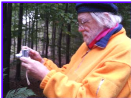
Den yngre redaktør på jagt efter "gammelheder".