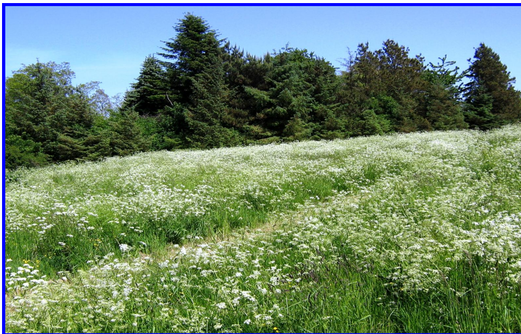
Men dette har nu også sin charme