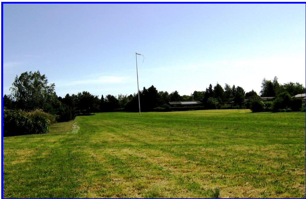
En nyslået eng ser jo altid nydelig og velholdt ud