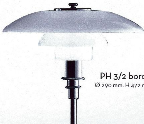
PH 3/2 bord Ø 290 mm. H 472 mm