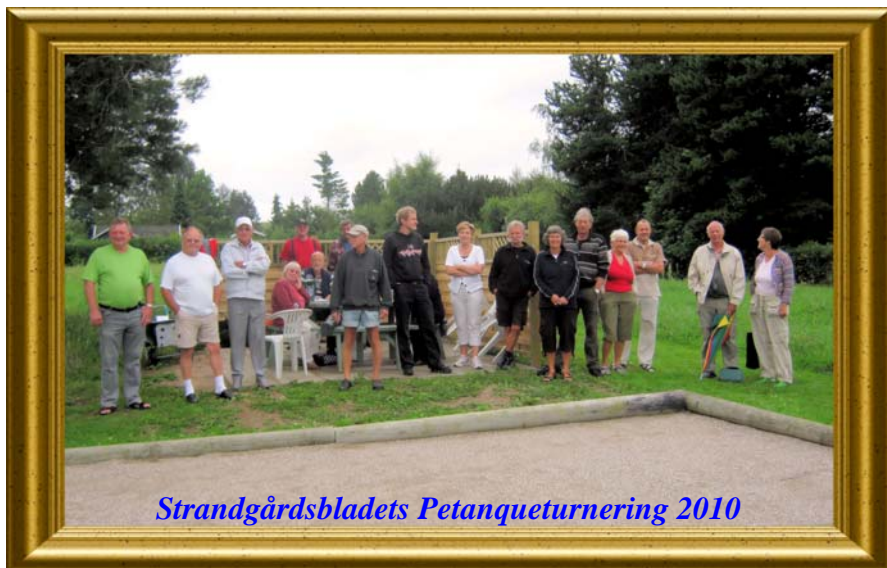
Strandgårdsbladets Petanqueturning 2010