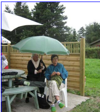
Regnen kunne ikke holde hverken deltagere eller tilskuere væk .