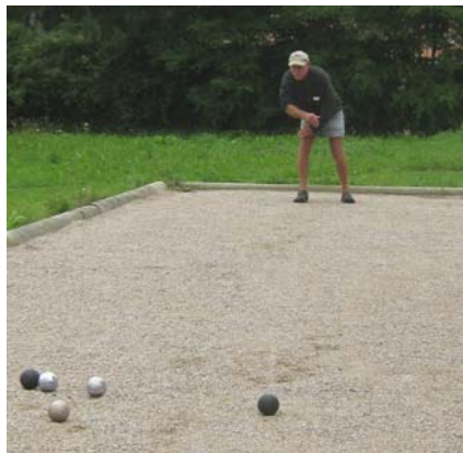
Tæt på Bent, men ikke tæt nok.