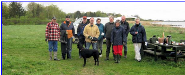
Fra badebroens opsætning i april 2010

Har du ikke været med før og har du "hænderne skruet rigtig på" har du chancen d. 2. oktober. Meld dig til og deltag i et hyggeligt samvær med lidt sund sved på panden