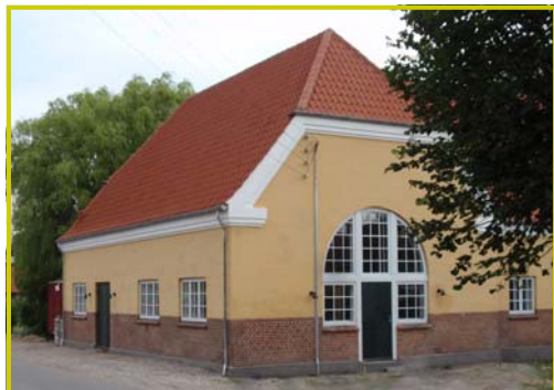
HUSET på NÆSSET Udbyvej 52 , Tuse Næs