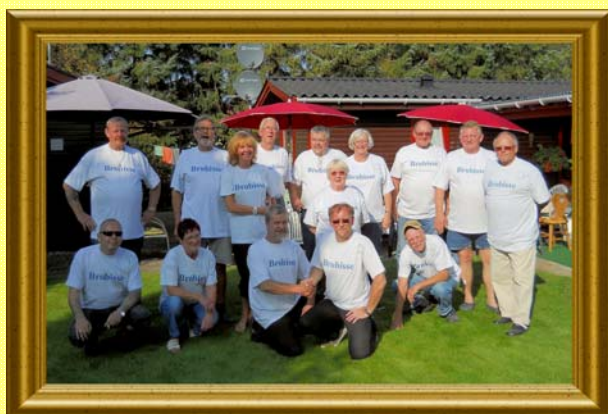
Brobisserne - 2011